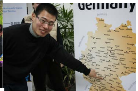
Die Zulassung von Freiburg kam erst etwas später!