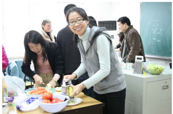
Beim gemeinsamen Kochen am Deutschkolleg.