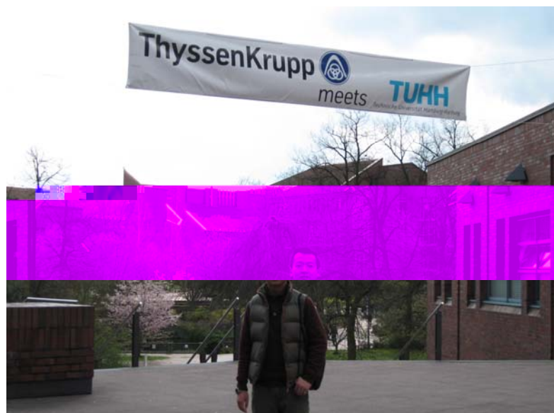
Die ersten Fotos vor der TUHH